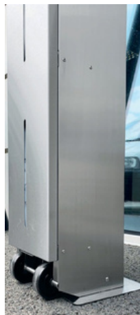
Sichtstreifen für Gelstand