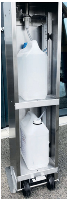
Lagerbereich für weiteren