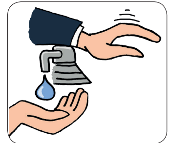
Aktion mit dem Unterarm

Leichter Druck mit dem Unterarm, um das Gel zu aktivieren. Leicht nachfüllbar. Kompatibel mit Gel und flüssigen Lösungen.