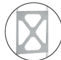
Verstärkungsstrebe an jeder Leiter im beweglichen Teil.

*Geben Sie uns bitte die Länge an (min. 2,50 Meter, max. 6 Meter)