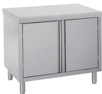
Meubles à portes battantes