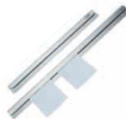
229 974 et 230 059