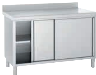
Meubles avec dossier