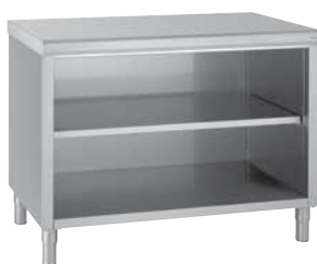
Ouverts sur 1 face