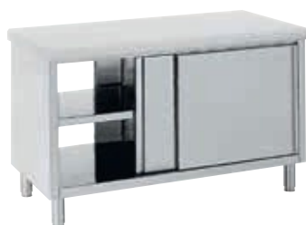
Portes coulissantes sur 2 faces