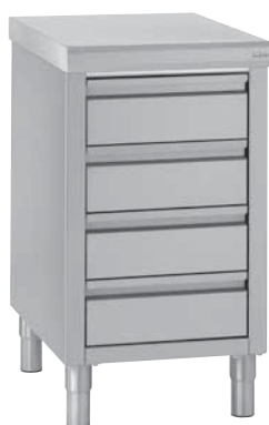
Meubles à tiroirs