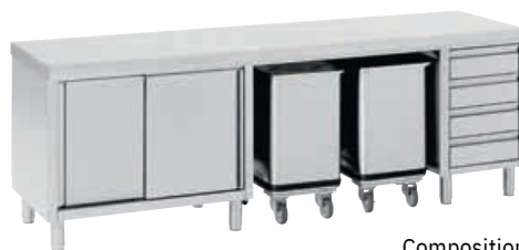
Composition de meubles

Les meubles standards ci-dessous sont conçus pour recevoir exclusivement des dessus de notre fabrication.