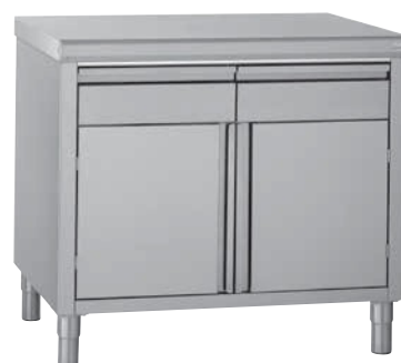
Meubles avec portes et tiroirs