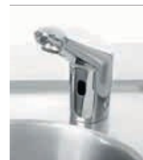
Robinet 230 507