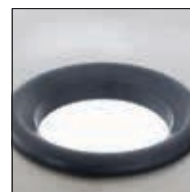
Öffnung für Abfall + Gummiring 701 102