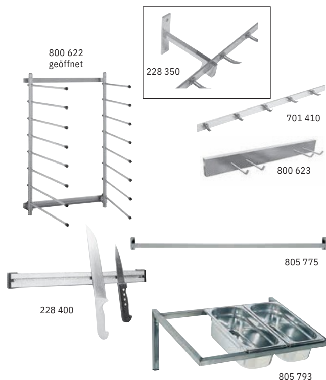
800 622 geöffnet