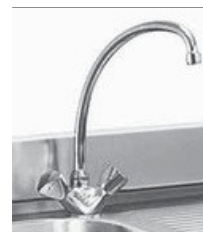
Robinet 230 300