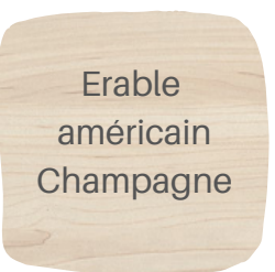
Erable américain Champagne