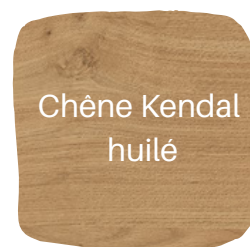
Chêne Kendal huilé