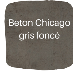
Béton Chicago gris foncé