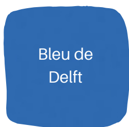
Bleu de Delft

Nous consulter pour les autres teintes possibles, les délais et les prix.