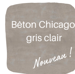
Béton Chicago gris clair