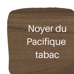
Noyer du Pacifique tabac