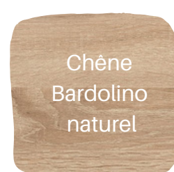
Chêne Bardolino naturel