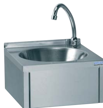
Réf. : 806 331

De forme carrée, 30 x 30 cm, il apporte la solution adéquate pour le lavage des mains, sans encombrement superflu.