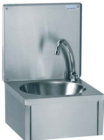
Réf. : 806 332