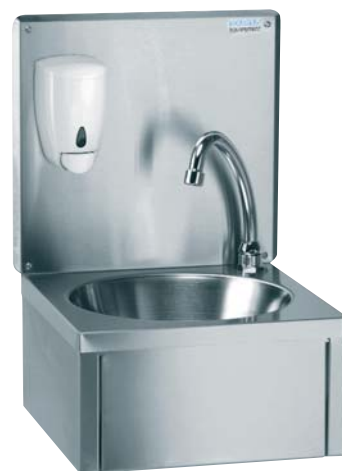
Réf. : 806 333

Réalisé en inox, le lave-mains GA est conçu pour une utilisation durable avec un usage intensif. L'arrivée d'eau est déclenchée par une palette à commande au genou.