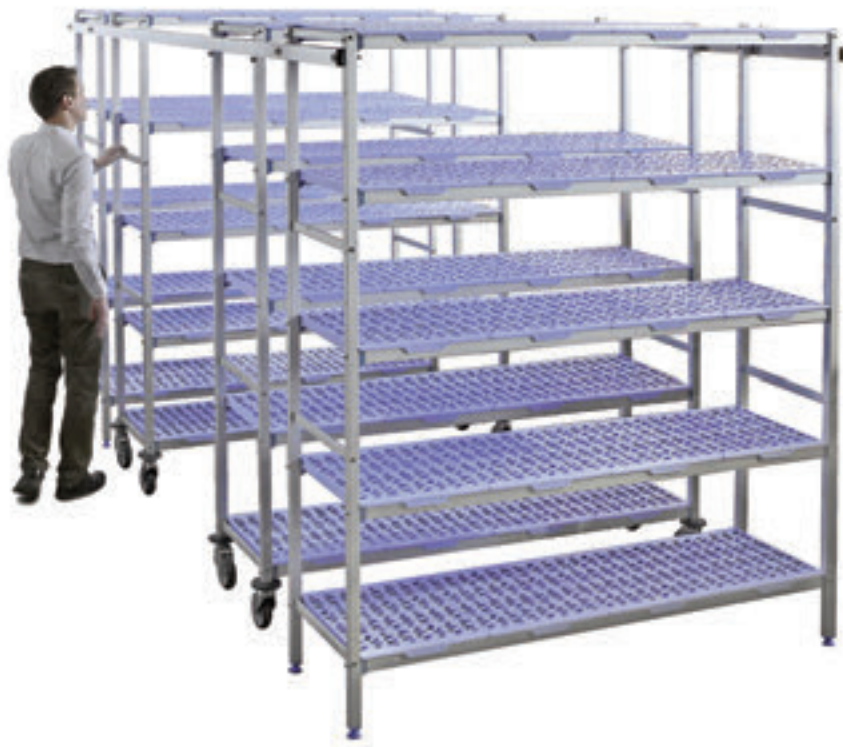
SYSTÈME DE GUIDAGE

Pour passer commande, nous fournir un plan du local en situant la position du rayonnage, l'emplacement des portes et des éventuels évaporateurs.