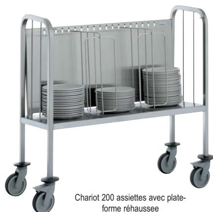
Chariot 200 assiettes avec plate-forme réhaussée