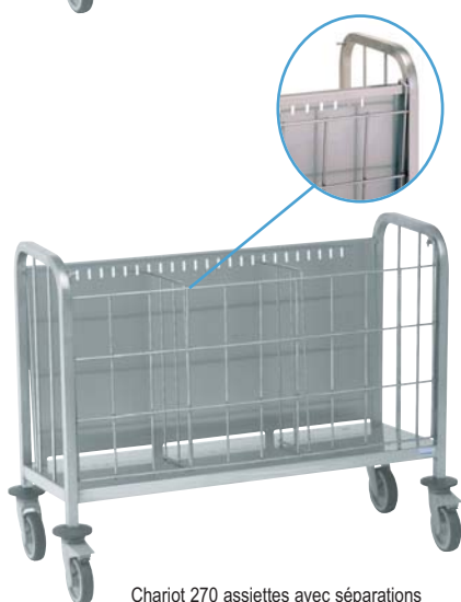
Chariot 270 assiettes avec séparations et grille avant amovible.