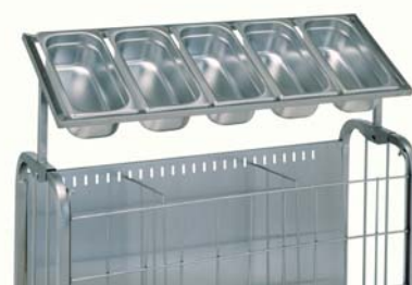
distributeur à couverts réf. 800 571 (bacs en supplément)