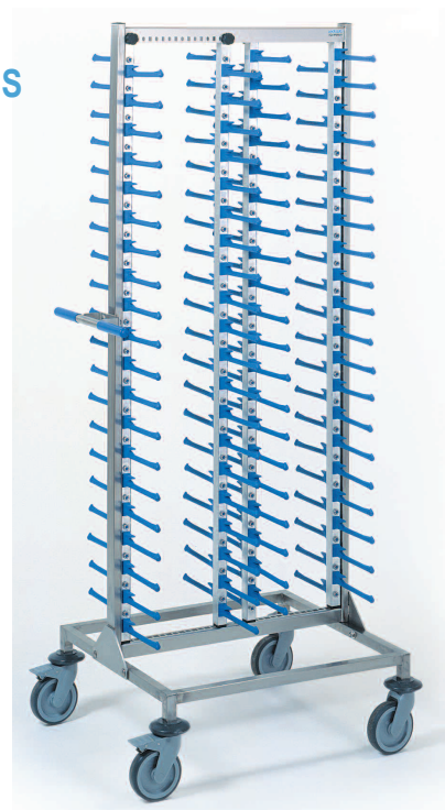
chariot porte-assiettes garnies

Chaque assiette est aussi bien tenue que par une main expérimentée. Les assiettes reposent sur 4 points , elles sont tenues par dessus et par dessous, assurant ainsi une position parfaitement horizontale. Grâce au revêtement anti-dérapant des doigts et au système de clips brevetés, les assiettes peuvent être transportées en toute sécurité.