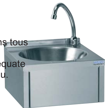
Réf. : 806 331

De forme carrée, 30 x 30 cm, il apporte la solution adéquate pour le lavage des mains, sans encombrement superflu.